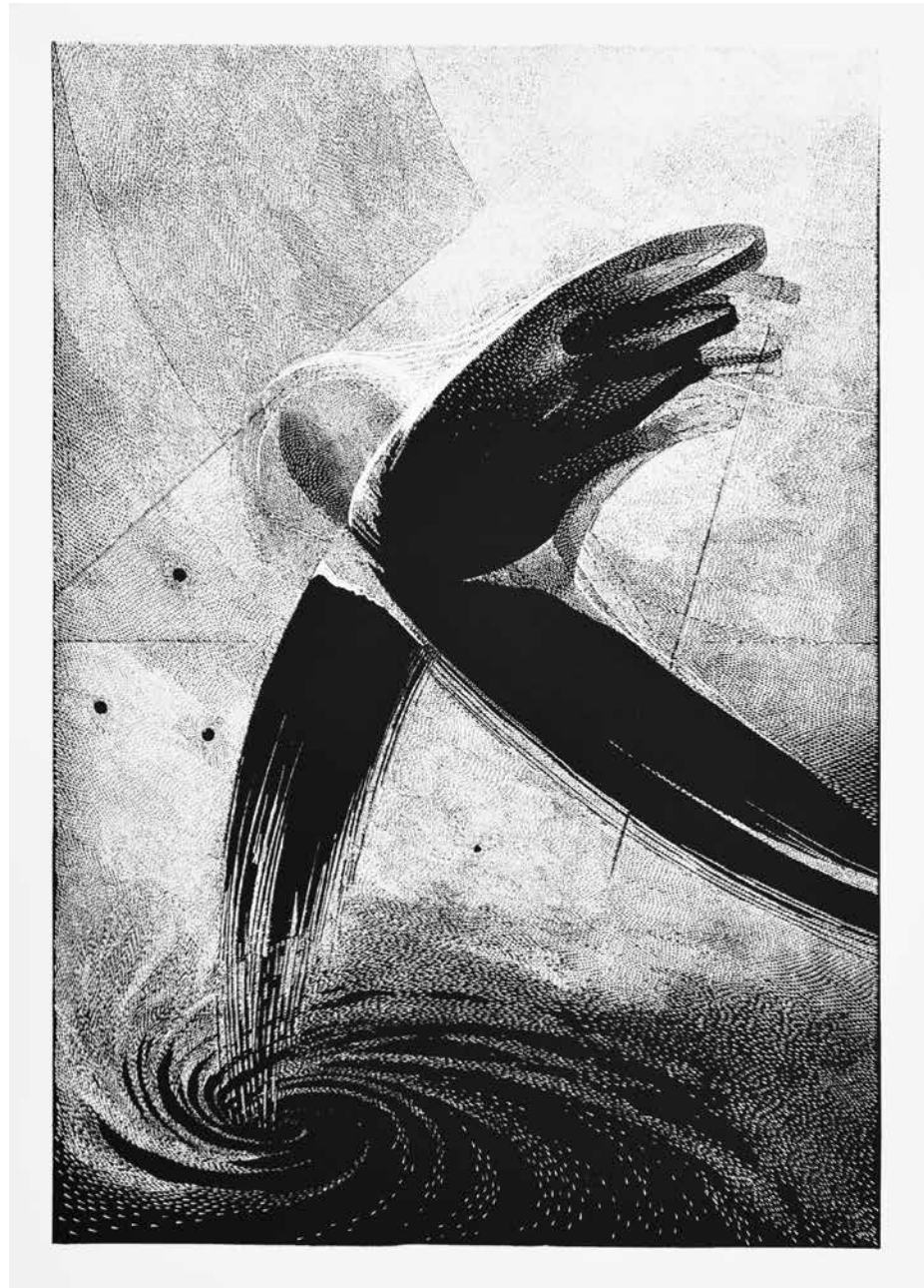
Ostatni z Ikarów , linoryt, 100 x 70 cm, 2018