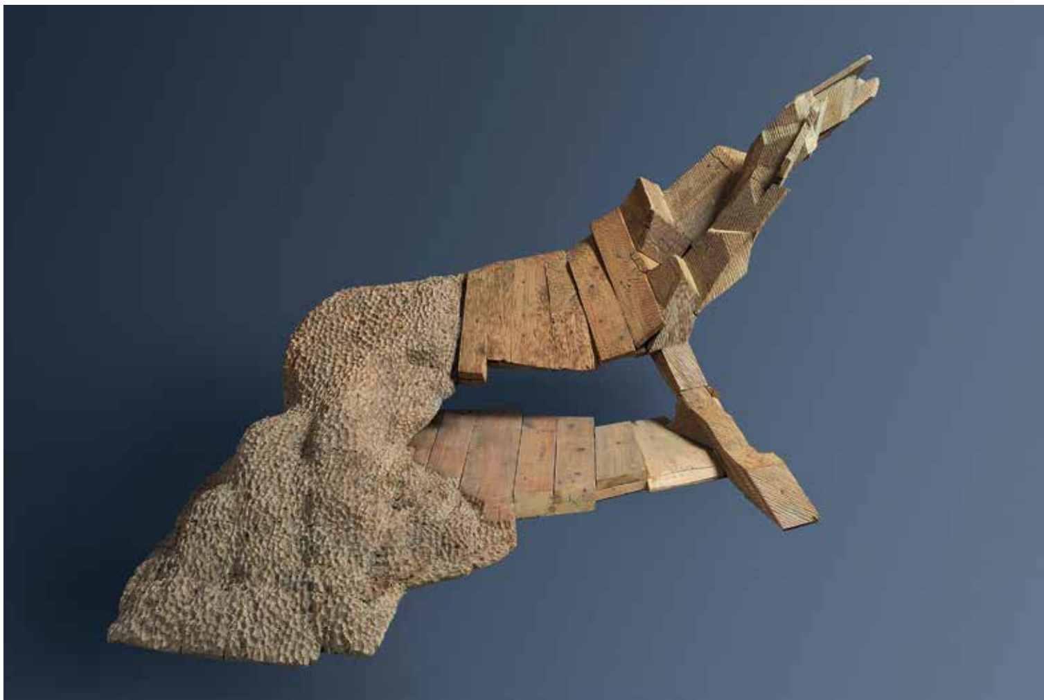
Kości IV z cyklu Cienie, drewno, 105 x 205 x 160 cm, 2010