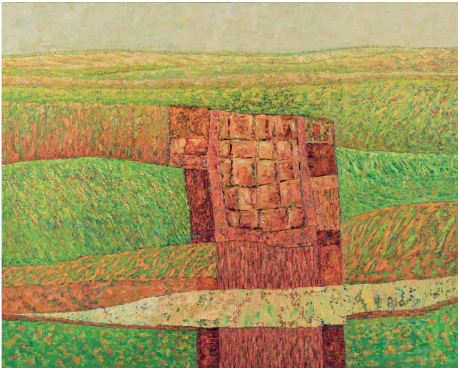
Locus II , olej, płótno, 80 x 100 cm, 2017